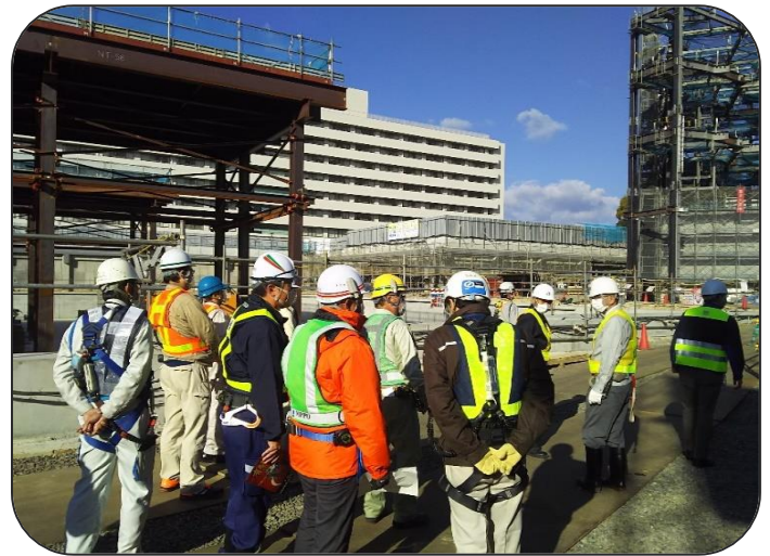
現場見学会の様子